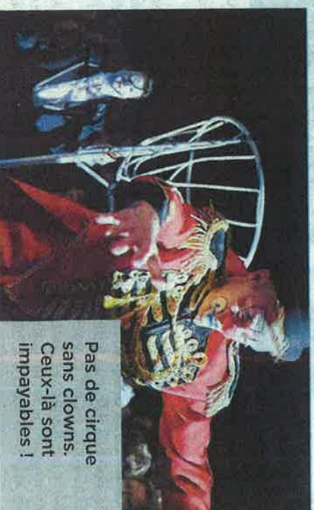
Pas de cirque sans clowns. Ceux-là sont impayables !

> Terrain de la fête foraine, à Rocheplard.