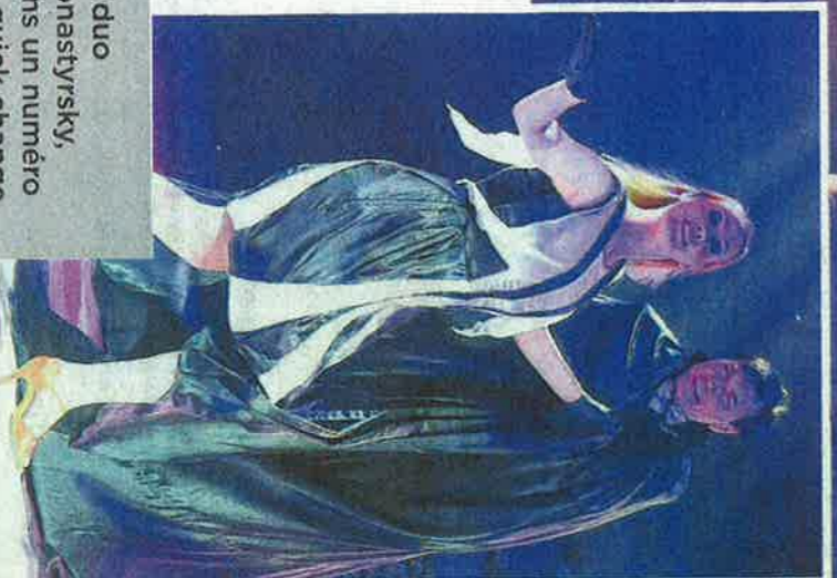
Le duo Monastyrsky, dans un numéro de quick change.

PAGE RÉALISÉE PAR DELPHINE COUTIER ET PATRICE DESCHAMPS